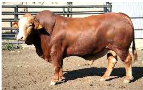
Lot 30 Taudicus Geneous