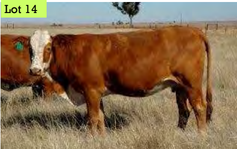
AZ0465B Cathy ge KI met Patriot

Vir "Die Event" is diere uit al die ouderdomgroeperinge geselekteer. Aangesien die kudde kwaliteit hoog is, was dit 'n moeilike keuse om die finale groep vir die veiling saam te stel. Die veilingsdiere is bestuur asof