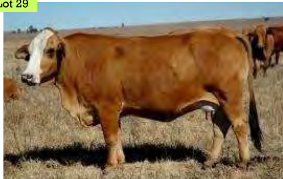
HDL99245A Charlise dragtig van Becherovka