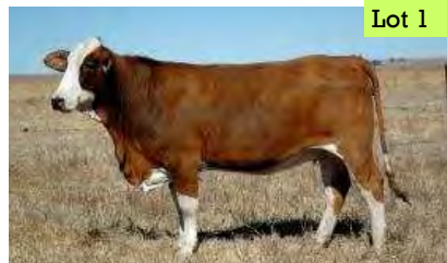
AZ0326C Koba dragtig met Mcix

Top females breed great bulls and are the corner stone to any successful cattle enterprise