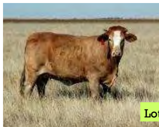
HDL02117B Coffee dragtig van Geneous