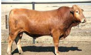
Lot 98 Cats