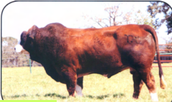
Lot 35 PRR Prosper