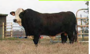
Lot 28 PRR Pantheon

Bill en Jane Travis is 24 jaar besig met 'n 40 jaar lange teelprogram. Streng seleksiemetodes wat gefokus is op die Pine Ridge teel doelwit word gebruik. Die eenvoudige vroulike diere wat deur Pine Ridge geteel word, is die bewys hiervan. Volgens Bill word geen kalf wat nie aan sy seleksie kriteria voldoen as teelmateriaal in die Pine Ridge kudde behou nie. Pine Ridge beeste is donkerrooi met swart velpigment vir beter hitte weerstand, goeie haar kwaliteit, baie lengte en struktureel korrek. 90% van die kudde is natuurlike poenskoppe en elke aspek van die totale teelprogram