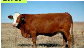
AZ0251B dragtig van Mcix