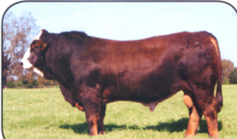
Lot 28 PRR Prevail