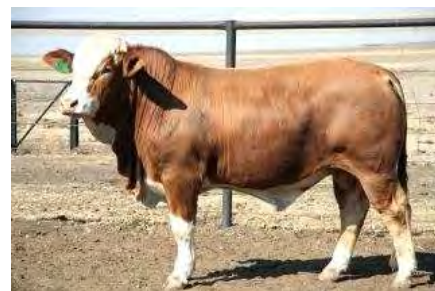
Lot 99 Zamugo Xenophanes

Die eerste seun van Diana's Gugi wat ooit by Excelsus verkoop gaan word. Greywing is geteel uit 'n prag F1 koei wat aanhou goeie beeste teel en ook een van die vrugbaarste koeie by Excelsus is. Greywing het goed geskou en is gebruik as skoonmaakbul in ons KI program. Hy is nie vir gebruik op verse nie. Greywing sal uitsonderlike groei aan enige kudde gee. Gebruik Greywing op grootraam koeie om bespieroing te verbeter.