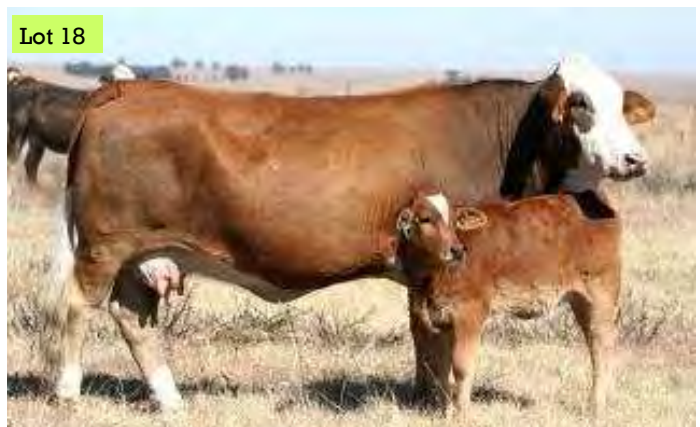
HDL025B Disco met n Mcix versie en ge KI met Zorro

enige stoet of kommersiële kudde toevoeg.