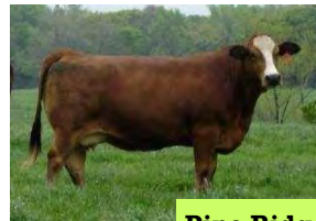
Pine Ridge Koeie

Sien al die Pine Ridge bulle op www.simbrah.com