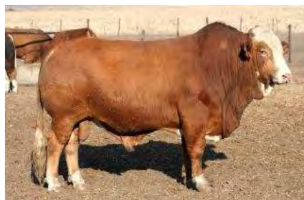
Lot 85 Greywing