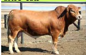
Lot 94 Creol