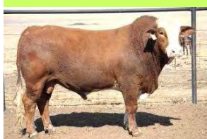
Lot 82 Cheka